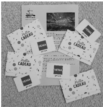
Namens het paasactieteam van de ARK, Ria de Rijke

Dit jaar kochten we 428 supermarktbonnen en 168 bonnen van de HEMA. Daarmee maakten we heel veel mensen, die dit goed kunnen gebruiken, blij. Blij met de bonnen en blij met de aandacht die men op deze manier kreeg. Deden wij dat? Nee, u maakte dit mogelijk! Onze hartelijke dank gaat naar alle particulieren en instanties die aan deze actie hebben bijgedragen.